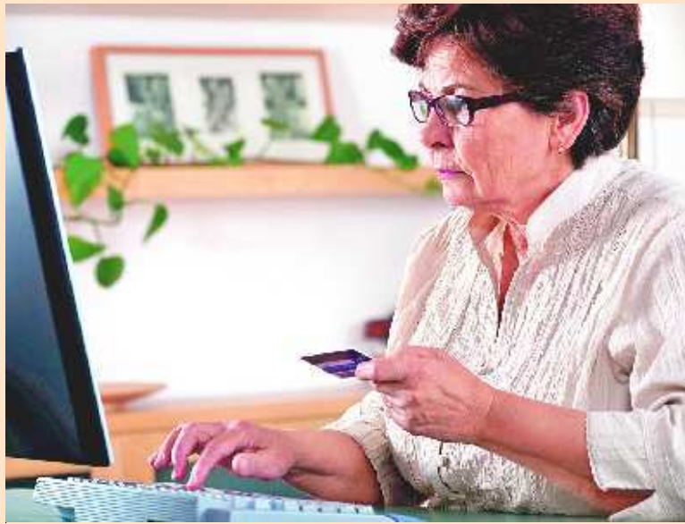
(NE)UPORABNIKI – Največji delež uporabnikov e-bančništva je v starostni skupini od 30 do 49 let, med izobraženimi ter med zaposlenimi, neuporabniki pa so predvsem mladi, manj IKT-pismeni, starejši in novi uporabniki interneta.

En razlog za (ne)uporabo e-bančništva je delež uporabe oziroma dostopa do interneta. Slovenija sicer v tem kazalcu minimalno zaostaja za evropskim povprečjem, zaostanek pa se v zadnjih letih